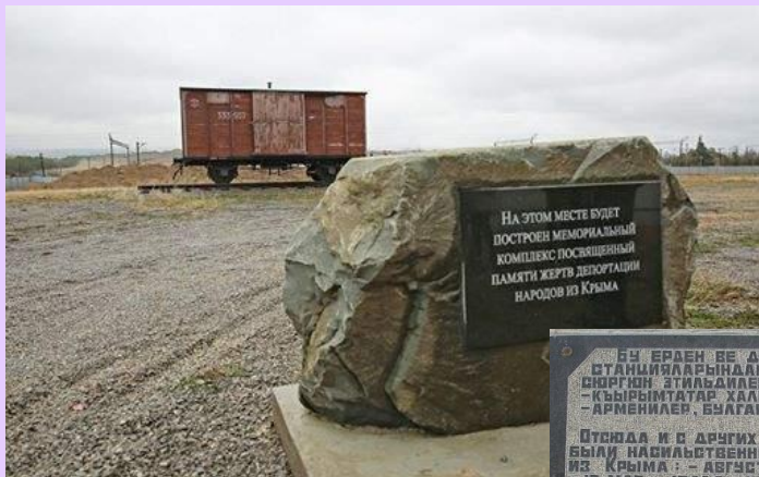
Станция Сирень, Бахчисарайский район

БУ'ЕРДЕН ВЕ АЕМИР ВЛУНЫН'ДИГЕР СТАНЦИЯЛАРЫНДАН ДОРБАЛЪКЪ ИЛЕ КЪЫРЫМДАН -КЪЫРЫМТАТАР ХАЛКЪЫ-МАЙИС 18 1944 С. -АРМЕНИЛЕР, БУЛГАРЛАР, ГРЕКЛЕР-ИЮНЬ 1944 С. Отсюда и с других железнодорожных станций были насильственно вывезены депортированные из Крыма: - август 1941 г. - немцы - 18 мая 1944 г. - крымско татарский народ - июнь 1944 г. - армяне, болгары, греки. Здесь та інших залізничних станцій були насильно вивезені депортовані з Криму: - серпень 1941 г. - німці - 18 травня 1944 г. - кримськотатарський народ - червень 1944 г. - вірмени, болгары, греки.