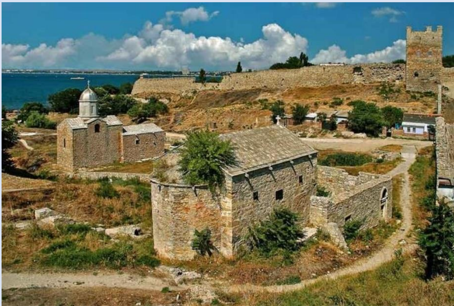
Крепость Айоц-берд (XIII век, Феодосия)