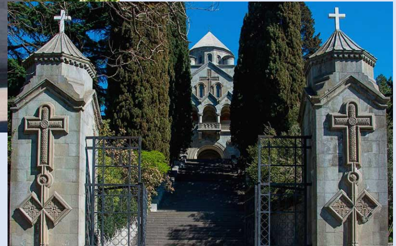
Армянская церковь Св. Рипсиме (Ялта)