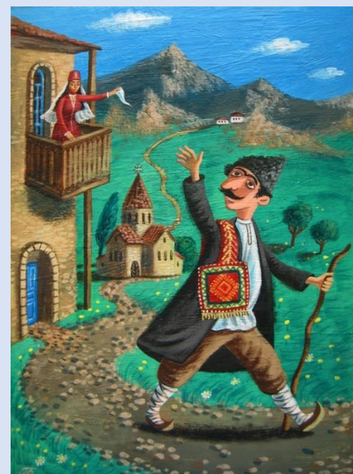
Сказка «Счастье глупца»