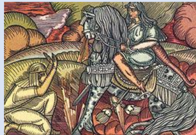
Эпос «Давид Сасунский»