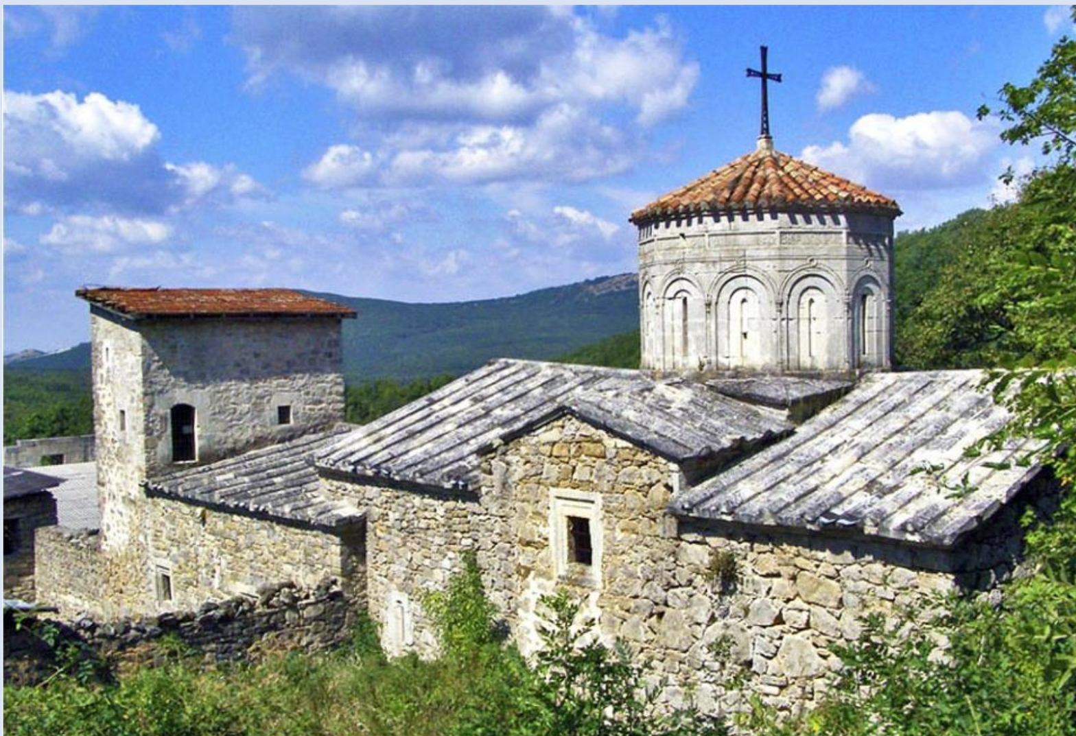
Монастырь Сурб-Хач (XIV век, Старый Крым)