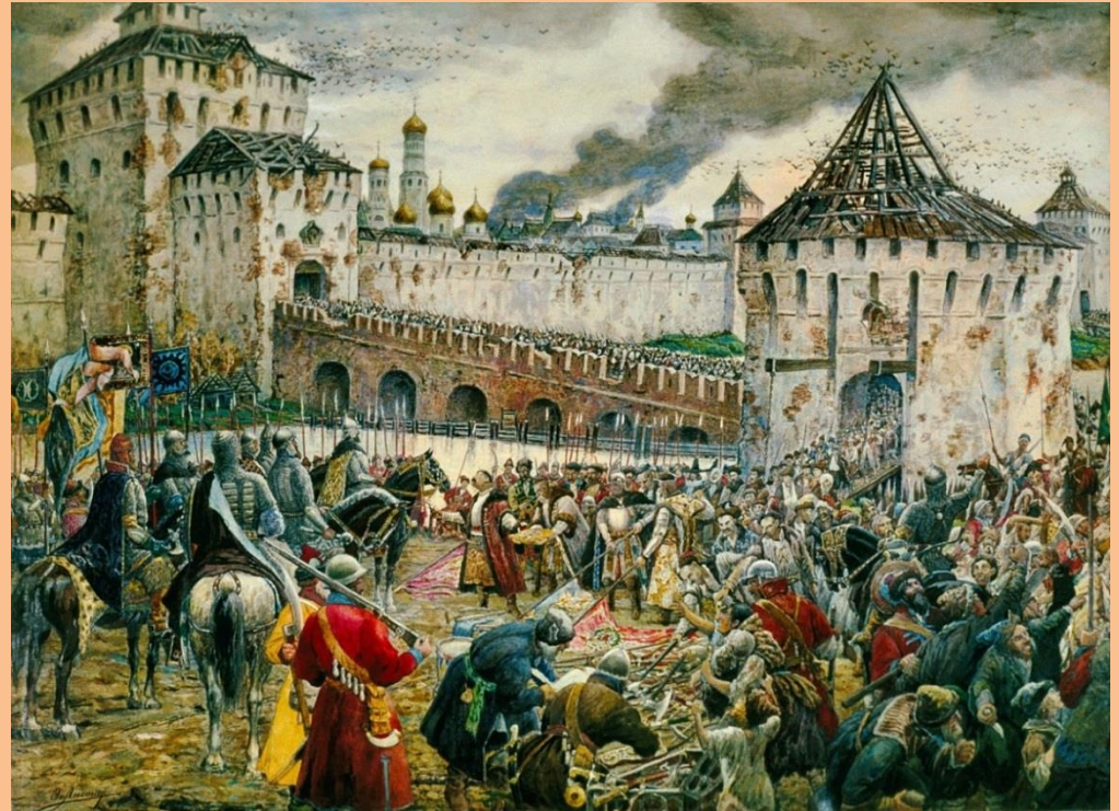
Э. Лиснер. Изгнание польских интервентов из Московского Кремля. 1908 год

4 ноября 1612 года объединённое войско вошло в Кремль и освободило столицу от иноземных захватчиков.