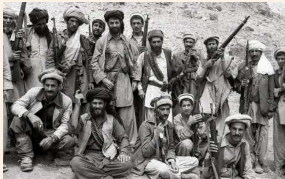
афганские моджахеды («душманы»)