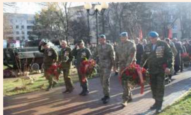
Торжественное мероприятие 15 февраля 2015 года