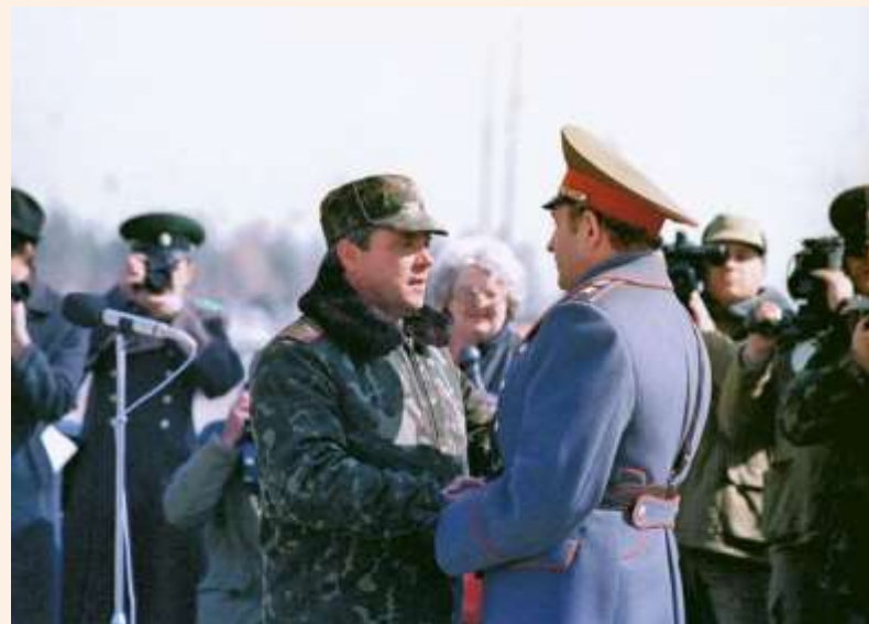
Борис Громов рапортует о завершении вывода войск из Афганистана