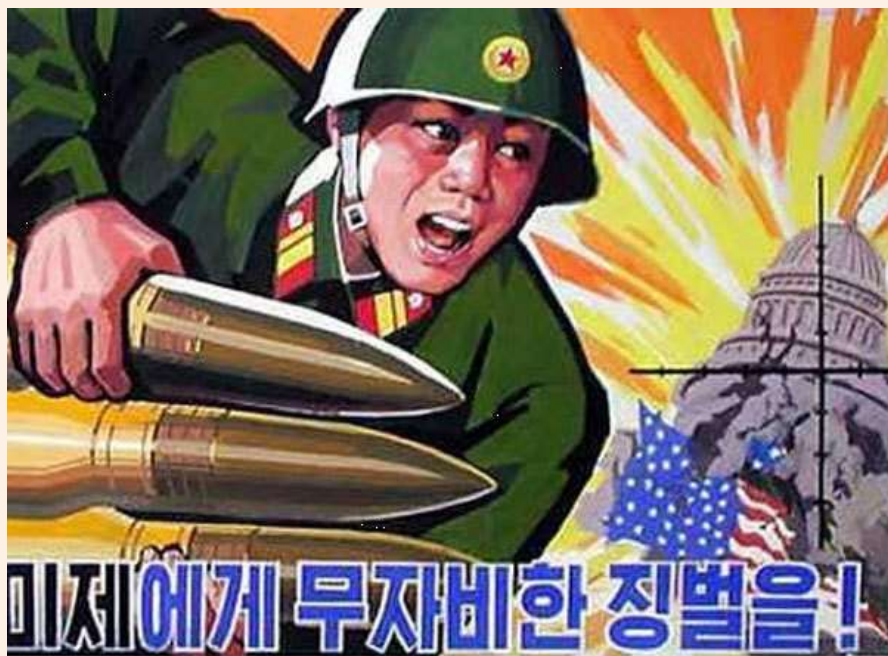
Конфликт на Корейском полуострове (1950–1953)