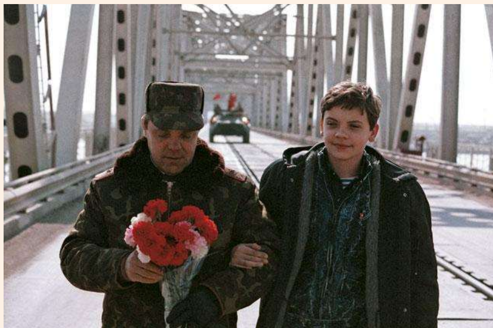
15 февраля 1989 года. Генерал-лейтенант, командующий 40-й армией Б. Громов на советско-афганской границе